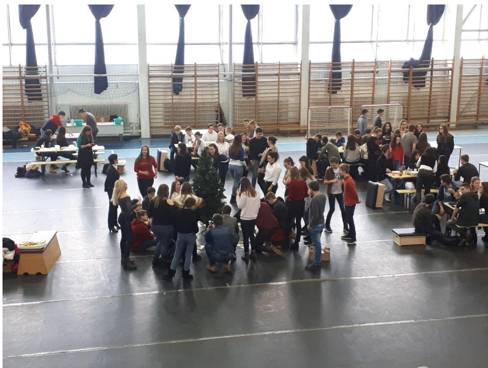
2018.12.14. Adventi vígasságok (gimnázium és általános iskolák programja)