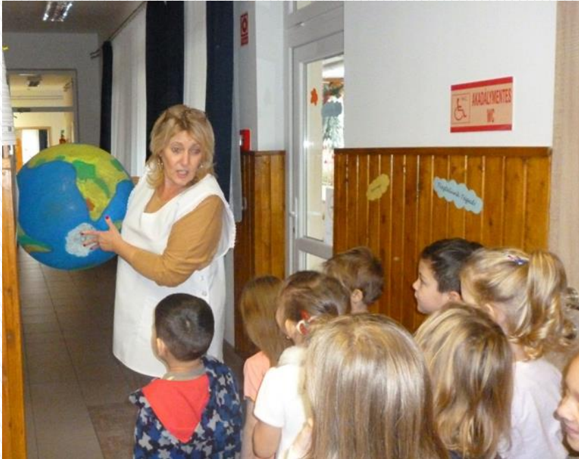
Kék bolygó kincsei