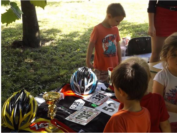
BSI futónagykövet MASZK egyesület